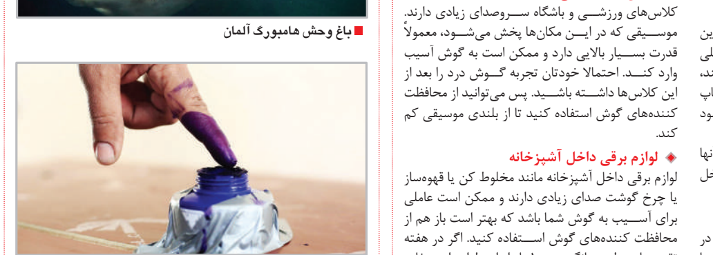
برگزاری اولین انتخابات شوراهای استانی - عراق