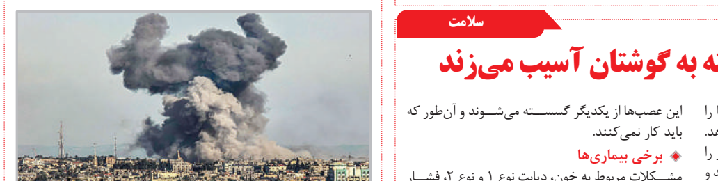
۷۵ روز جنایت