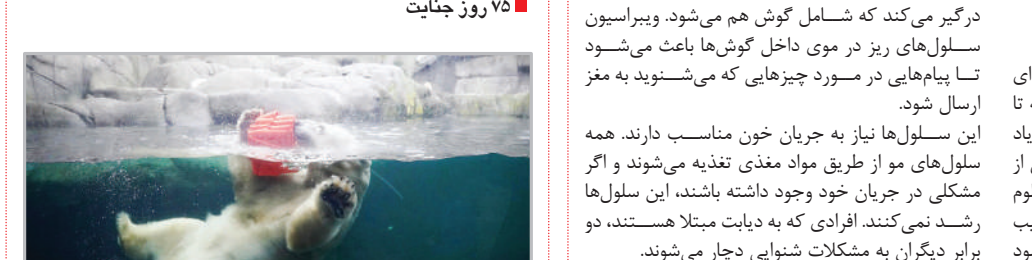
باغ وحش هامبورگ آلمان