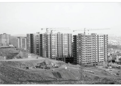
یک ساختمان مسکونی در شیراز

که تعهد خود را نسبت به بیمه کارگران ساختمانی کاهش داده؛ تعداد زیادی از کارگران در صف بیمه هستند و از سوی دیگر همزمان بیمه بسیاری دیگر قطع شده است. قانون سال ۹۳ در واقع بعد از مدتی ضمانت اجرای خود را از دست داد و قرار شد «طرح اصلاحیه ماده ۵ بیمه کارگران ساختمانی» و منابع موضوع ماده ۵ آن اصلاح شود. قانون جدید بیمه کارگران ساختمانی در واقع قرار است کمیبود منابع صندوق تأمین اجتماعی را جبران کند، کارکردی که نمی‌توان چندان به آن خوشبین بود. این قانون، بر مبنای همان قانون سال ۹۳، پروانه ساختوساز را به عنوان سهم حق بیمه کارفرما در نظر گرفته، در حالی‌که طرح پیشنهاد شده از سوی کارگران و کمیسیون اجتماعی، حداقل دستمزد کارگران را مبنای سهم حق بیمه کارفرما قرار داده بوده، طرحی که به اعتقاد نمایندگان فعال کارگر ساختمانی با حمایت گروه کارفرمایی کنار گذاشته شد و امید کارگران را به حل مشکل کمتر کرد. ghazanfari@sobhannews. ir