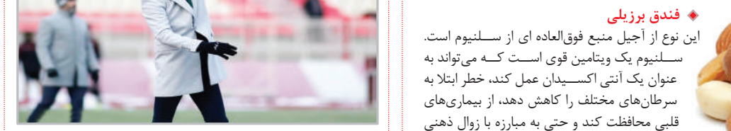
لیگ برتر فوتبال کشور