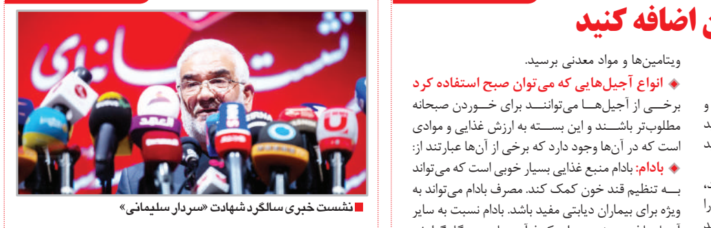
نشست خبری سالگرد شهادت «سردان سلیمانی»