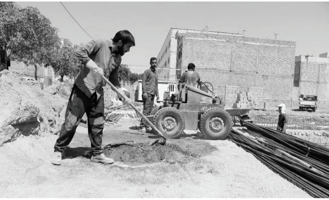
یک کارگر ساختمانی

در بیمه کارگران ساختمانی نداشتیم، ولی سازمان تأمین اجتماعی همچنان از محل صدور پروانه‌های ساختمانی منابع خود را دریافت کرده است. رکود بخش ساختمان باعث بیکاری ۷۰ درصدی کارگران ساختمانی شده است. ساداتی گفت: مازندران قریب به ۷۰ هزار کارگر ساختمانی شناسایی شده دارد که نزدیک به ۲۰ هزار نفر در انتظار بیمه تأمین